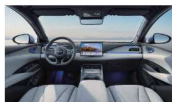
Gris Perle / Noir