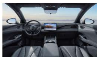
Noir / Bleu